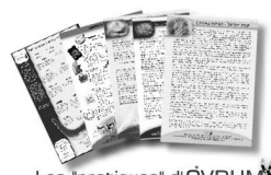
Les 'pratiques' d'OVDHM

Merci de nous faire part de vos remarques ou suggestions