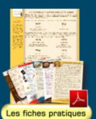
Les fiches pratiques