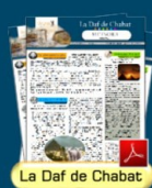
La Daf de Chabat

Vous appréciez «La Daf de Chabat» et désirez faire partie des abonnés ou participer à son édition, veuillez prendre contact dafchabat@gmail.com